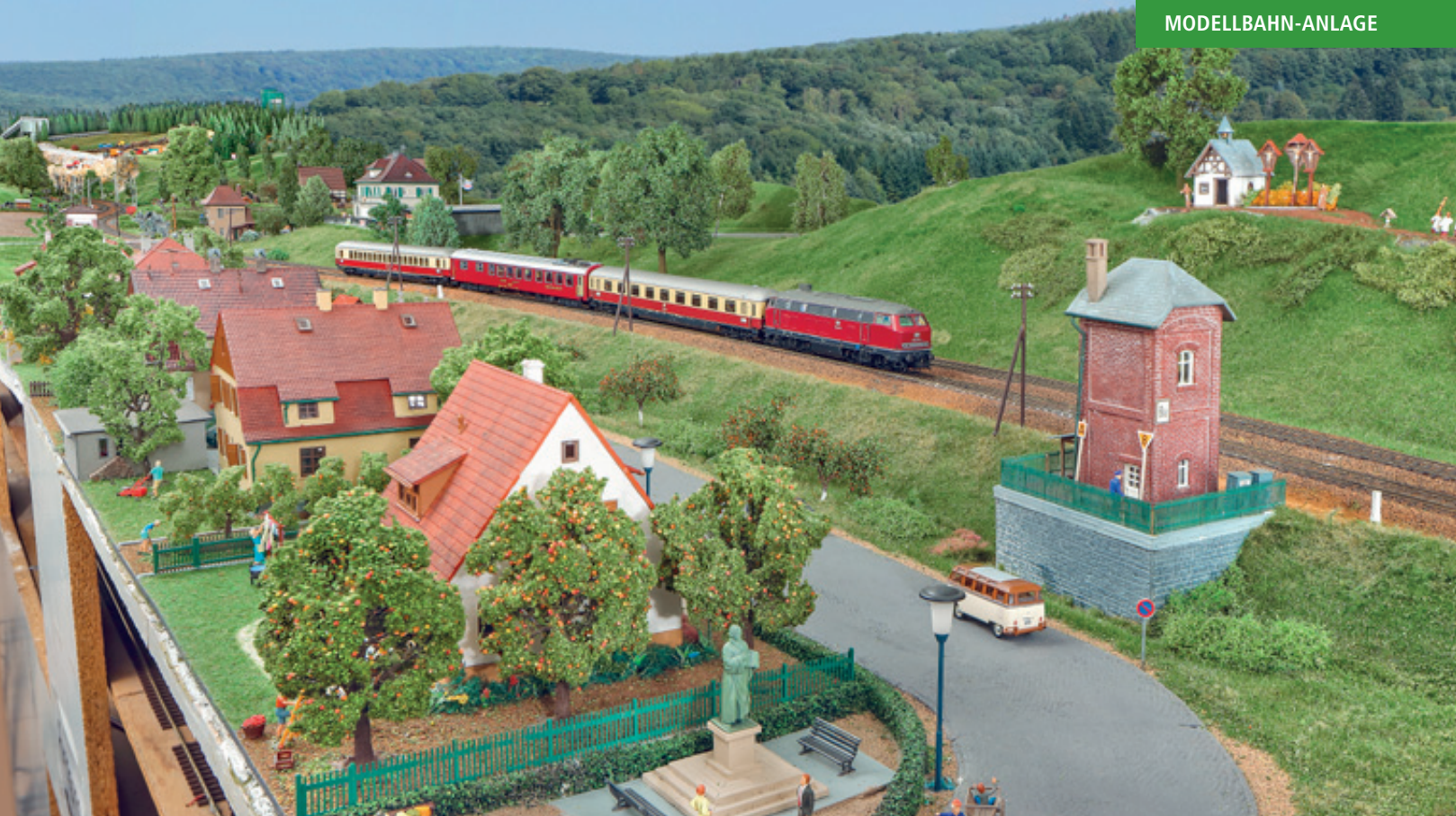
Oberhalb der neugestalteten Corona-Straße befährt eine 210 mit dem TEE „Bavaria“ im Schnellzugtempo die lange Paradestrecke.

Der Marktplatz wurde auf einer etwa 6 cm dicken Styrodurplatte aufgebaut. Die Platte wurde fast auf den Millimeter genau zugeschnitten und mit einem festen Rahmen aus 2-mm-Sperrholz eingefasst, damit im Laufe der Jahre nicht die Eckbereiche beschädigt werden. Die Arbeitsluke mit dem Marktplatz kann vom Umlauf der Modellbahnanlage her zusammen mit einem Modellbahnkollegen eingesetzt werden. Der Kollege befindet sich sitzend auf der dort installierten Bodenplatte in der Gleiswendel und führt den Marktplatz in die Rahmenlücke ein. Etwas Fingerspitzengefühl und Achtsamkeit ist beim Einsetzen erforderlich, aber es passt sehr genau.