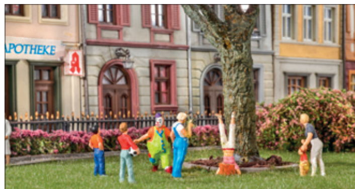
Auch auf Szenen abseits des täglichen Geschäfts wurde Wert gelegt. In einer kleinen Parkanlage entstand diese herrliche Spielwiese.