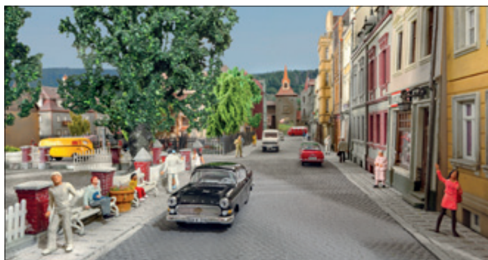
Die Straße wurde der Epoche III angemessen lebhaft gestaltet. Damals waren noch nicht so viele Autos unterwegs.

Vor kurzem wurde eine schon lange geplante bauliche Anlagenergänzung auf der Nordseite der Anlage am Bahndamm