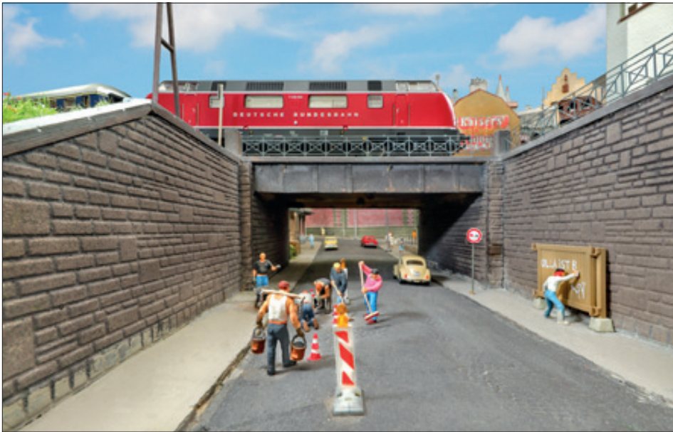
Die Straße zur Unterführung wurde mit einer kleinen Baustelle gestaltet, wo noch echte Handarbeit angesagt ist. Auch hier hält sich der Straßenverkehr in Grenzen.

Die langen Züge schlängeln sich eindrucksvoll über die gekonnt geführte Paradestrecke.