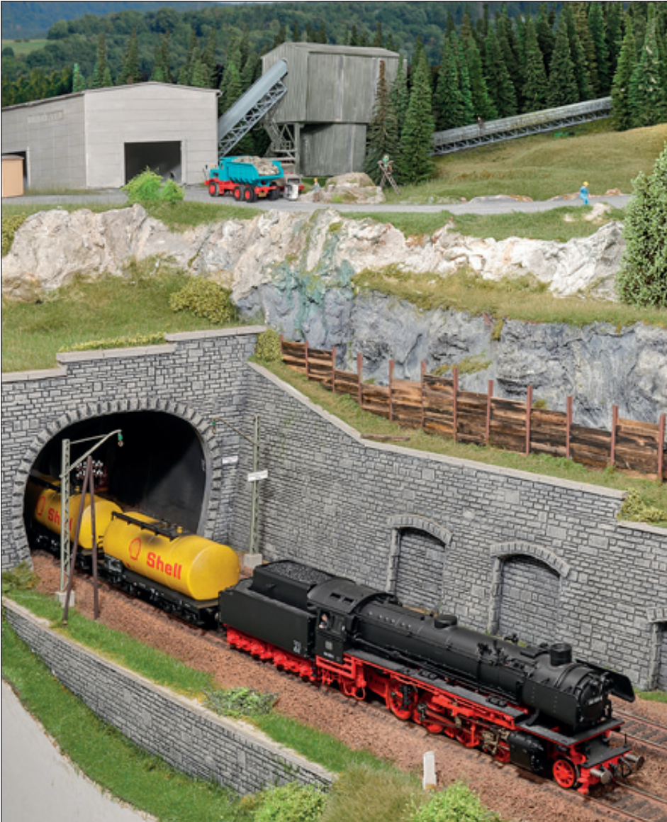
Nach langer Fahrt vom Schattenbahnhof kommende verlässt der Kesselwagenzug unterhalb des Steinbruchs den Tunnel und befährt die weitläufige Paradestrecke in Richtung Stadt.