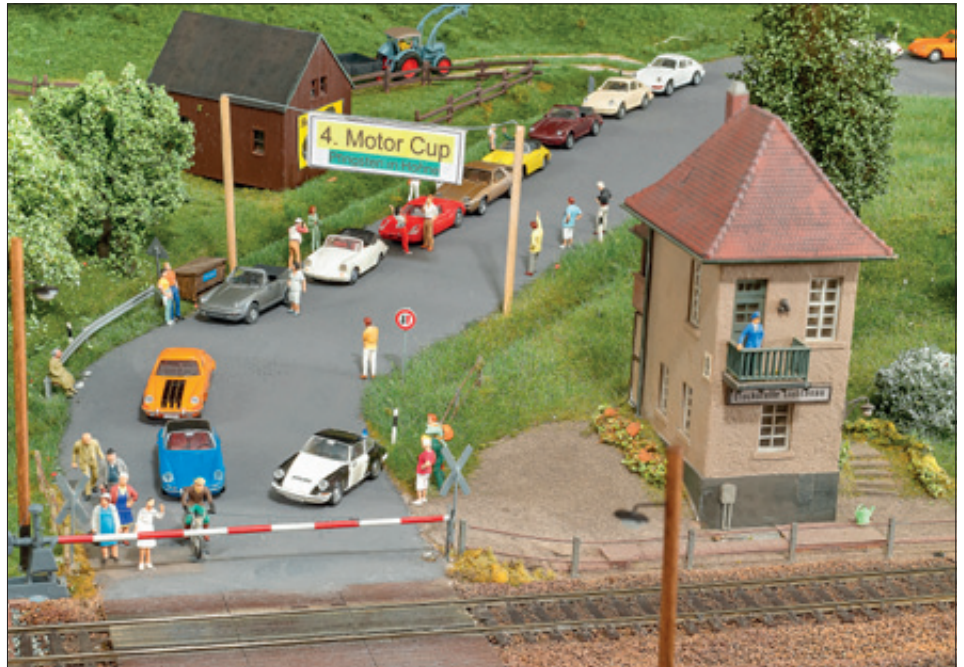
Die „Porsche-Rallye“ wird durch die häufig geschlossene Schranke gestoppt. Über Servos werden die Schrankenbäume vom TrainController geschlossen und geöffnet.

Während die Teilnehmer der Rallye warten, naht endlich der von einer 03.10 gezogene Heckeneilzug. Beachtenswert ist der Feldweg neben der Bahnstrecke.