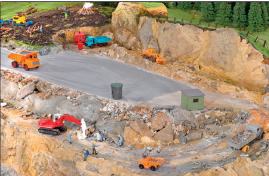
Im Steinbruch sind nicht nur allerlei Tätigkeiten mit Baggern und Lastern nachgebildet. Ein Muldenkipper ist per Faller-Car-System unterwegs und sorgt für Abwechslung und Bewegung.

In MIBA 9/2022 stellten wir den unteren Teil der HO-Anlage mit dem großen Durchgangsbahnhof vor. Heute geht es nach vielen Windungen in der Gleiswendel gut einen Meter höher auf die weitläufige Paradestrecke der Vereinsanlage. Detlev Höhn berichtet über Betrieb und durchgeführte Umbauten.