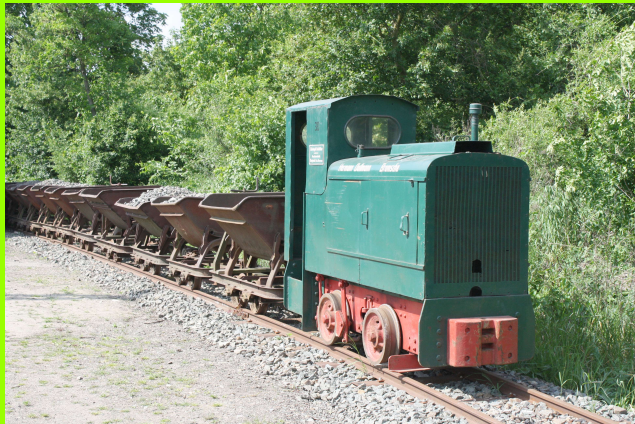
Schotterzug mit SCHÖMA LO 30