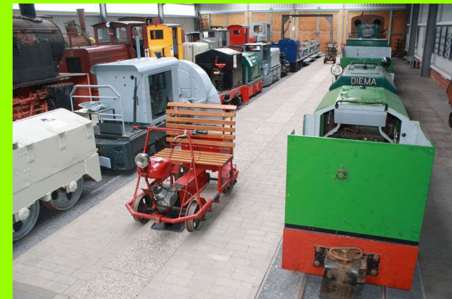
Blick in die Museumshalle

Wie früher in den Betrieben wird auch bei uns viel improvisiert. Ein alter Schuppen ist unsere Werkstatt und bei schönem Wetter wird sogar unter freiem Himmel geschraubt.