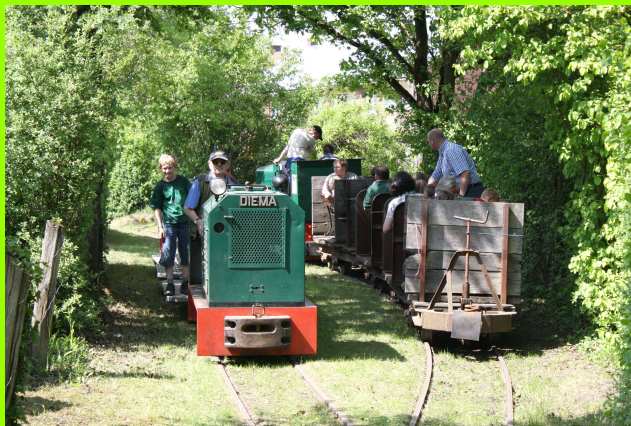
Personenzüge - Blumen pflücken während der Fahrt verboten!

Im Museumsbestand befinden sich über 50 Lokomotiven und mehr als 150 Wagen aus Sand- und Tongruben, Torf- und Kalkwerken, Baufirmen sowie Grubenwagen aus dem Kohlen-, Ton-, Erz- und Spatbergbau.