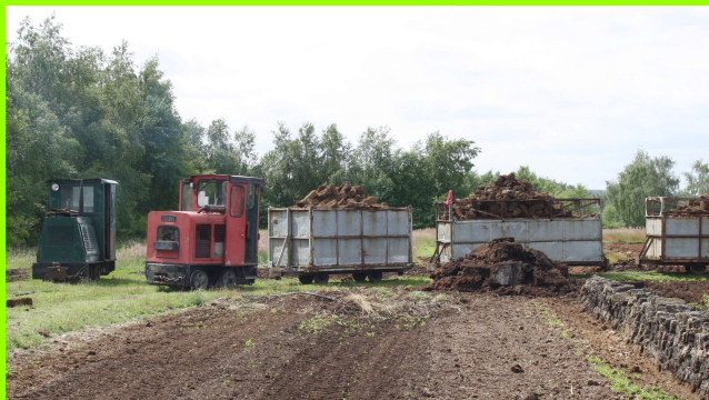
Torfbahn im Kalkrieser Moor bei Venne

Heute findet man dieses urige Transportmittel fast nur noch in den Mooren Norddeutschlands - oder in Museen.