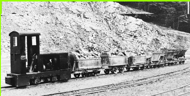
Lorenzug in den fünfziger Jahren im Steinbruch Lienen-Höste

“Feldbahnen”, das sind die ganz kleinen Eisenbahnen, die ab ca. 1870 die Transporte in der Landwirtschaft, in Wäldern, Steinbrüchen, Sand- und Tongruben, in Fabriken und auf Baustellen übernahmen. Im Krieg dienten sie dem Transport von Soldaten und Material und danach dem Trümmertransport aus den zerbombten Städten.