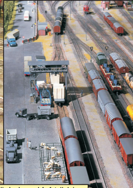
Blick über die Lade- und Aufstellgleise