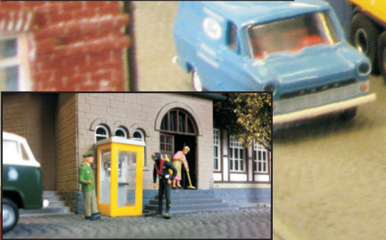
Untere Ebene Der Kopfbahnhof